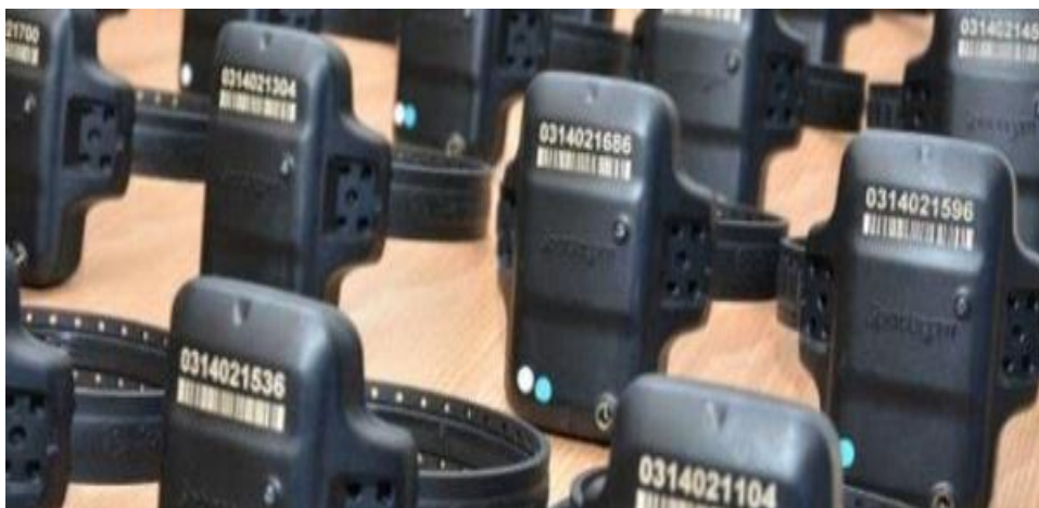
Figura 2 – Tornozeleira Eletrônica

Essas pessoas – processadas criminalmente ou condenadas – são obrigadas a portarem de forma contínua e ininterrupta um dispositivo para tal monitoração em tempo real: a tornozeleira eletrônica. A figura 1, abaixo, mostra tal objeto e a figura 2 mostra o aparelho instalado em uma pessoa: