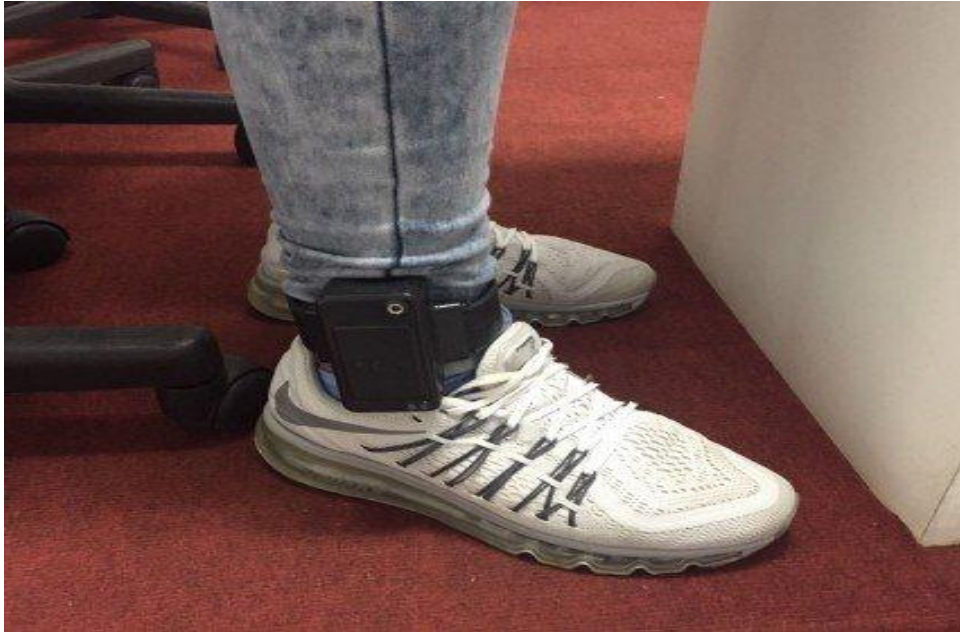
Figura 3 - Tornozeleira Eletrônica instalada