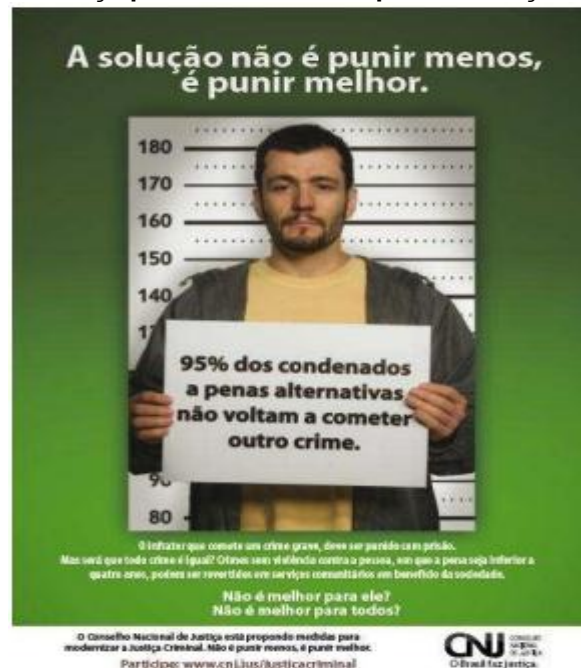
Figura 1 - Peça publicitária da Campanha Justiça Criminal